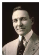
ロータリー財団の創設者、アーチ C. クランプ(1916年頃) (写真提供: Rotary Images) ©はクハ-