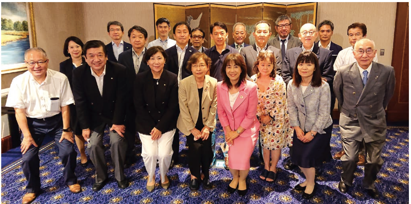
グループ協議会で「コロナ禍のクラブ運営」について協議。 会長・幹事の皆さんと、一瞬、マスクを外して「はい、ロータリー！」

折しも、今年度は日本のロータリーが100周年を迎える、節目の年です。コロナ危機の「機」は「opportunity (機会)」の「機」でもあります。「バリアフリー・マインド」で活動し、機会の扉を開き、ロータリーの新たな礎を築く年度とするべくチャレンジする時なのではないでしょうか。