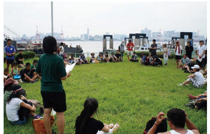
ドリームキャッチャプロジェクト (お台場にて)

歴史あるロータリーの素晴らしい先輩ロータリアンと未来を担う若手ロータリアンが融合して、機会の扉を開けて、「バリアフリー・マインド」でデジタル化を推進し、2030年には誰も取り残されない時代がやってまいりますように、私も一助となれるようロータリー活動を頑張っております。